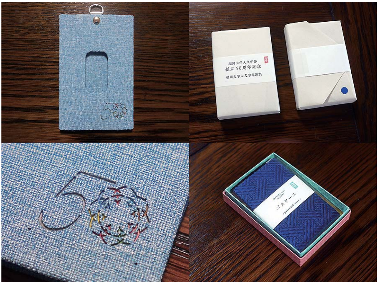
(例) 福岡大学人文学部様 50周年記念 記念品

記念品や返礼品などに、ロゴマークや名前などを入れてお作りすることが出来ます 生地をご支給いただき制作も可能です 詳しくはお問合せ下さい のし・包装もご要望に応じます